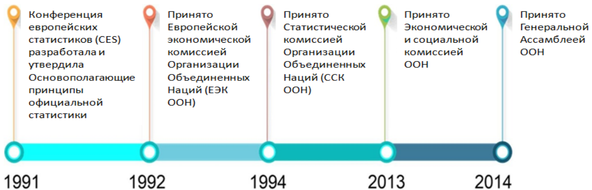
Рисунок 2: Генезис ОПОС (FPOS)

Признание универсальной применимости ОПОС было закреплено в 1994 году, когда Статистическая комиссия ООН приняла их. Это одобрение имело решающее значение для утверждения ОПОС в качестве основополагающих руководящих принципов для мирового статистического сообщества. Позднее, в 2014 году, Генеральная Ассамблея ООН подтвердила их роль в качестве основных стандартов, обеспечивающих, чтобы официальная статистика во всем мире служила надежным инструментом для понимания и улучшения условий жизни общества. ОПОС выступают за создание статистических данных на основе научных методов, профессиональной этики и прозрачности, подкрепляя их актуальность и достоверность при информировании о глобальной политике и управлении.