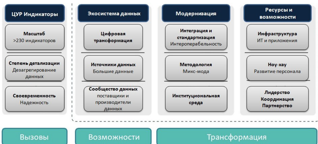
Рисунок 3: Вызовы и возможности для Официальной статистики

Разработка надежной нормативно-правовой базы крайне необходима в наш цифровой век, когда конфиденциальность и безопасность данных вызывают серьезные опасения. Эти рамки должны быть достаточно гибкими, чтобы решать уникальные проблемы, возникающие в связи с появлением новых технологий и источников данных, и обеспечивать соответствие статистической практики меняющимся требованиям цифрового ландшафта. Кроме того, поддержание соответствия глобальным стандартам и расширение международного сотрудничества становится необходимым для гармонизации методологий и подходов. Такое международное сотрудничество позволяет статистическим органам решать общие проблемы, обмениваться передовым опытом и использовать коллективные знания, подчеркивая роль официальной статистики как объединяющего элемента в глобальной информационной экосистеме.